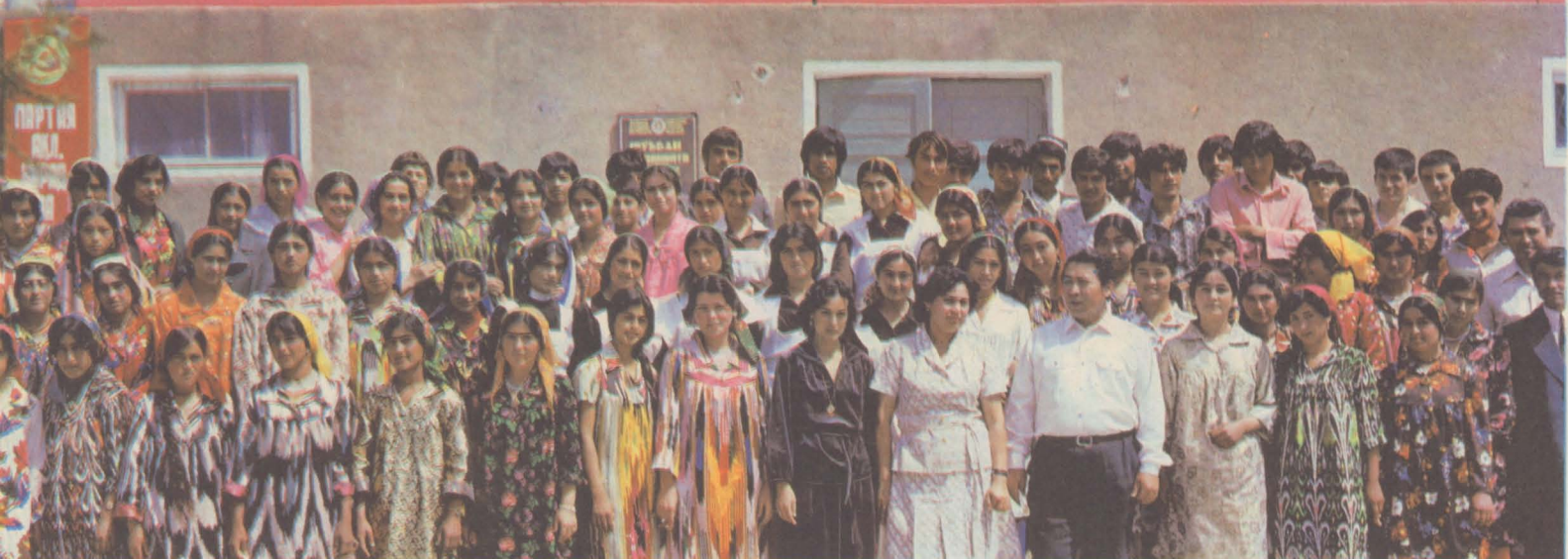
Эти выпускники средних школ Яванского района будут учиться в профессионально-техническом училище.