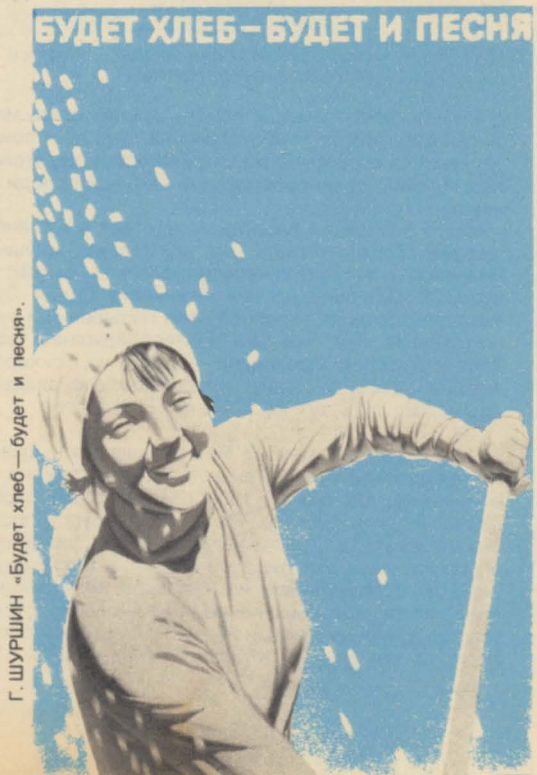
Г. ШУРШИН «Будет хлеб — будет и песня».