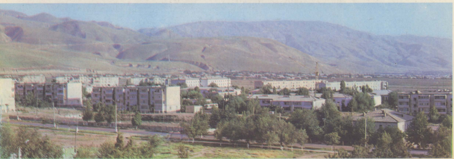
Один из заводских микрорайонов Явана.