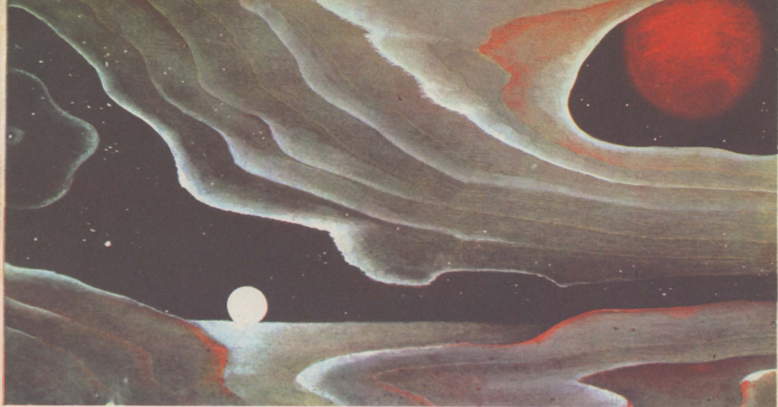
Под пологом сброса.