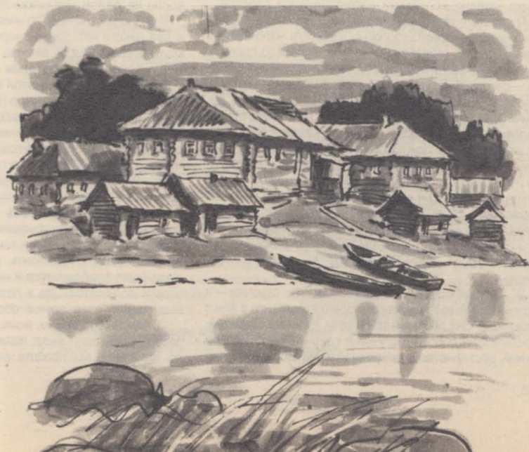
Рисунки В. ВЫСОЦКОГО.

Много позднее я сформулировал для себя принцип бережности в воспитании. От способности педагога к тончайшим духовным прикосновениям к детям зависит многое. Эти прикосновения — и взглядом, и улыбкой, и едва заметным движением, и ладонью, и подушечками пальцев, и поэтической строчкой, и ошеломительным хохотом, и игрой, и удивлением, и приказом, и взрывом гнева, и доброй увлеченностью — все эти прикосновения в основе своей нравственны.